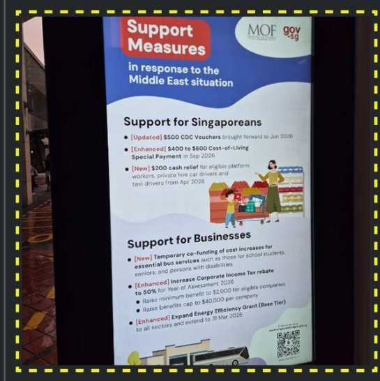
Medidas de apoyo ante las perturbaciones en Oriente Medio (Singapur)